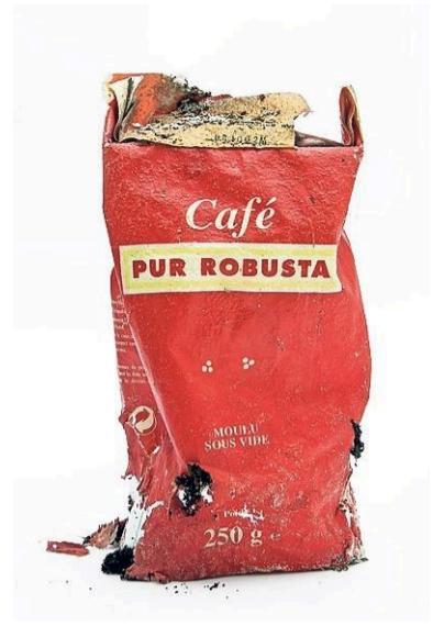
MARIËLLE PENRHYN LOWE

Het woord 'kunst' wordt niet altijd geassocieerd met fotografie. Toch is ook dit vakgebied ruim vertegenwoordigd tijdens de Kunstlijn 2018.